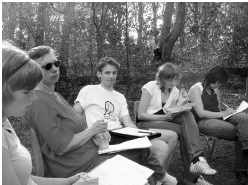
Sticka en andere cursisten luisteren tijdens workshop.