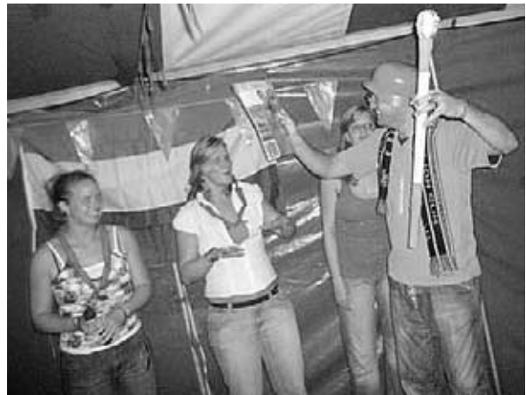
Karst ontvangt de eretitel 'Mr. Oranje'

Na wat ontspanning en afwassen, gingen we weer naar het feest. Deze avond zou er een "boer zoekt vrouw" verkiezing zijn. Van de 5 boerinnen die op het podium stonden werd de boer opslag verliefd op een van onze Vughtse gasten, en was er wederom een titel veroverd.