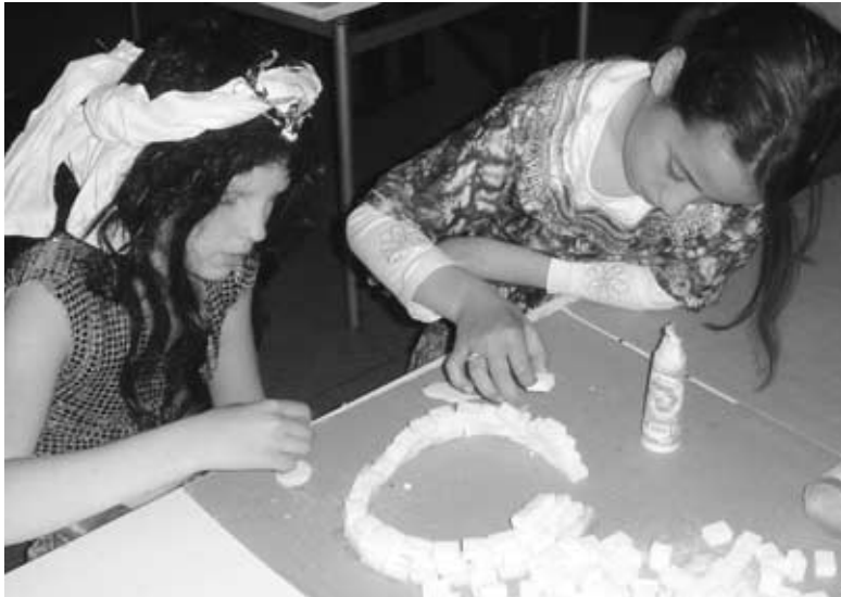
Iglo's bouwen op Antarctica

de bedoeling dat we zouden gaan zeilen. Dit ging helaas niet door, omdat het te hard waaide en er waren buien voorspeld. Toen zijn we maar naar Amerika gegaan, naar de indianen. Daar hebben we met z'n allen één totempaal gemaakt. Ieder groepje kreeg een grote doos en die moest beschilderd worden. Toen dit allemaal klaar was, zag het er erg kleurig uit. Daarna was het opruimen en toen buiten nog